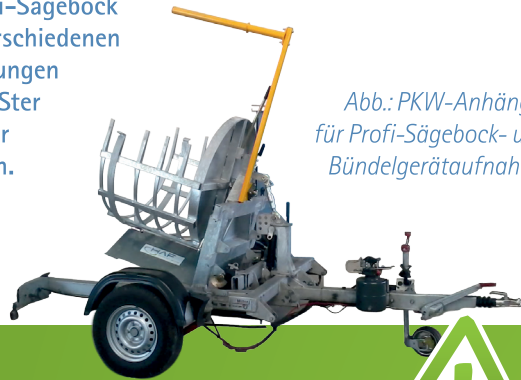
Abb.: PKW-Anhänger für Profi-Sägebock- und Bündelgerätaufnahme